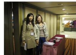
PMI HK staff 13