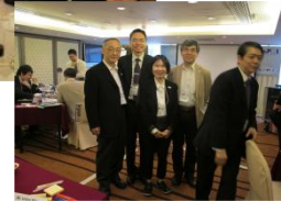
Speaker & PMI J staff